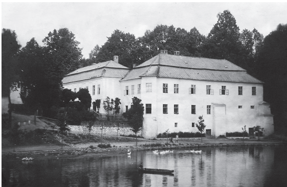
Obr. 1: Pohled na zámek Puklice od východu. Černobílá fotografie z 20. let 20. století (SOKA Jihlava, Neinventarizovaný fond, Kronika obce Puklice I., s. 134)

s oltářním obrazem Nanebevzetí Panny Marie. 20 Mše se v kapli sloužily od roku 1729, za veřejnou byla prohlášena v roce 1787, za Malovcových v roce 1804 byla rozšířena. Továrník Peška ji v roce 1893 zrušil.